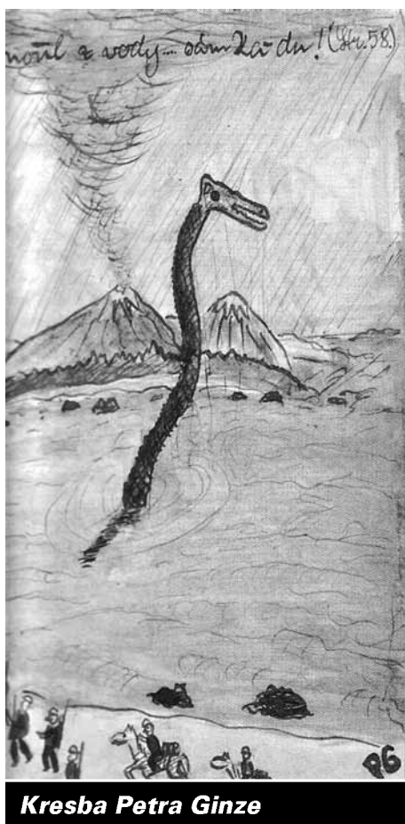
Kresba Petra Ginze